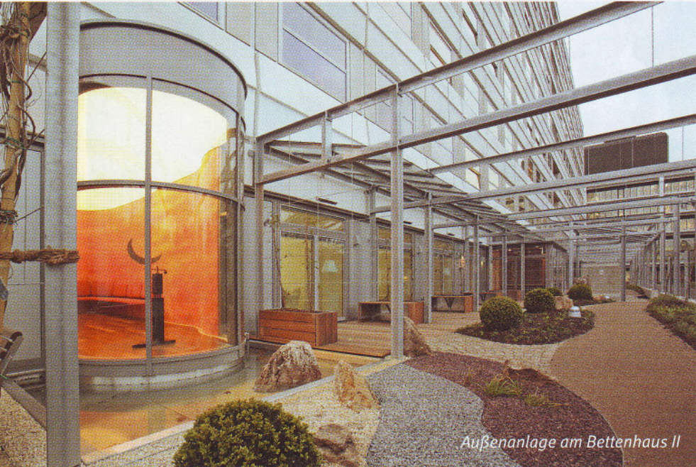
Außenanlage am Bettenhaus II